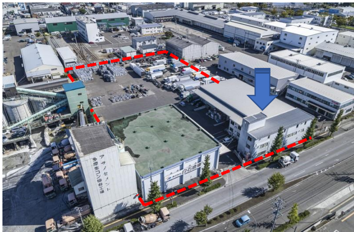
【ドローン外観写真】