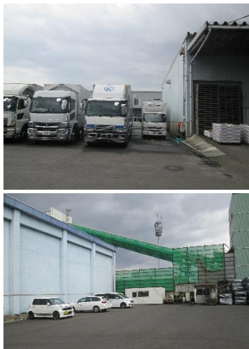
【駐車場候補地（敷地内）】