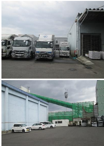
【駐車場候補地（敷地内）】