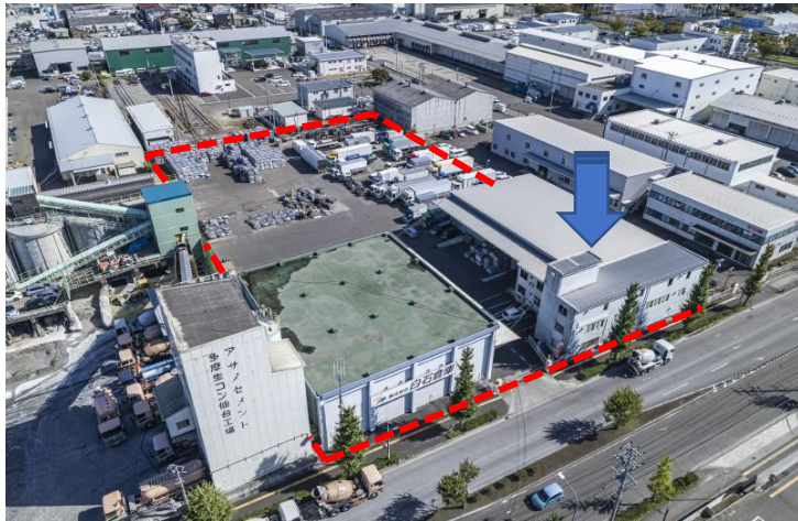
【ドローン外観写真】