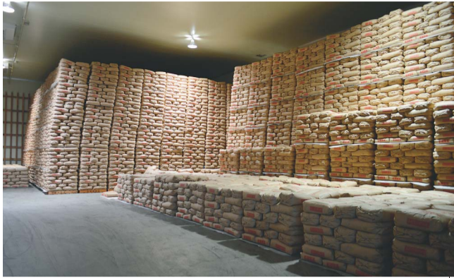
5年間保管する運用となっていた備蓄米倉庫①。放出の流れを受け相次いで空に②